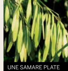
UNE SAMARE PLATE

Le fruit (les samares) est allongé et persiste dans l'arbre souvent jusqu'au début de l'hiver.