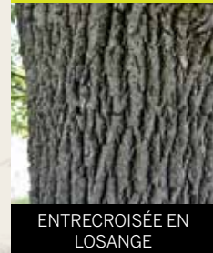
ENTRECROISÉE EN LOSANGE

L'écorce du frêne mature est fissurée et craquelée en profondeur. Celle du frêne blanc et rouge (les plus communs) se divise en crêtes un peu soulevées et entrecroisées en losange. L'écorce du frêne noir devient écailleuse avec l'âge et sa texture rappelle celle du liège.